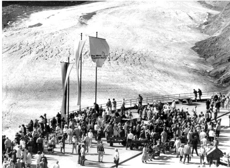
World Uranium Hearing auf der FJ-Höhe 1992