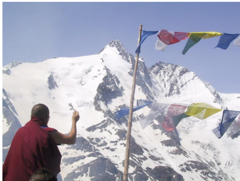
Rinpoche Latri Nyima Dakpa - Bergsegen