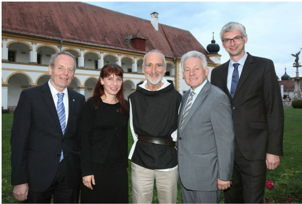
15. Reichersberger Pfingstgespräche, Linz, am 13.06.2011