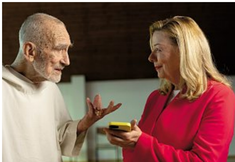
Wundervolle Begegnung mit dem größten Mystiker unserer Zeit.